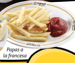
Papas a la francesa